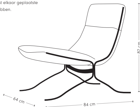
hoogte + breedte + diepte